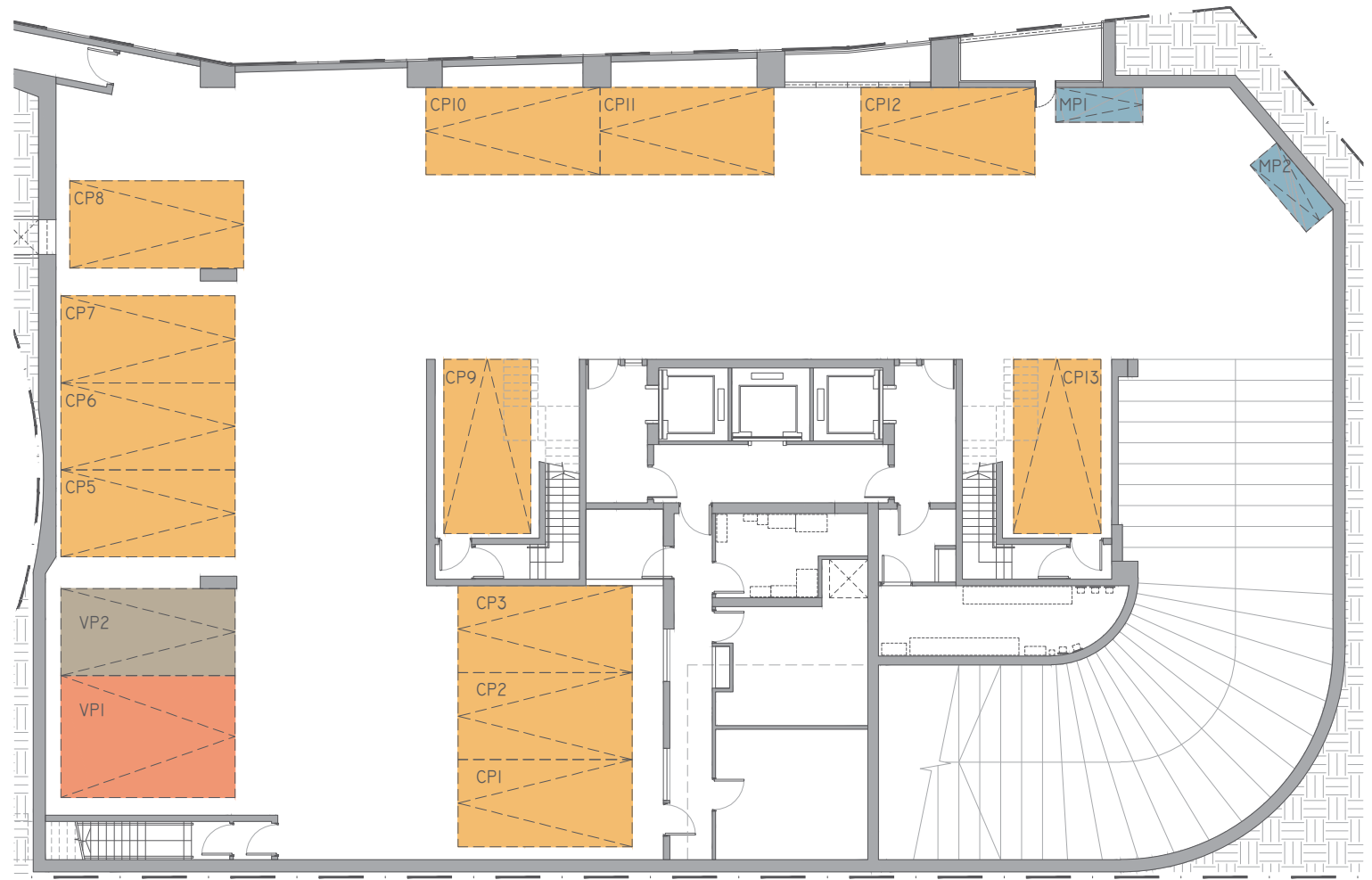
B/F Floor Plan (Part Plan) 地庫平面圖 (部份)