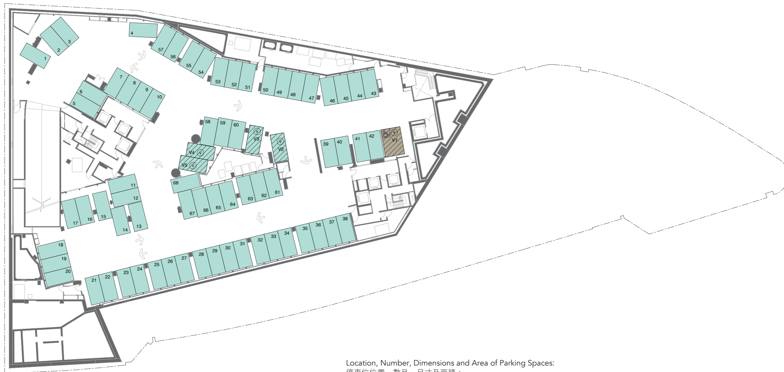
Location, Number, Dimensions and Area of Parking Spaces: 停車位位置、數目、尺寸及面積：