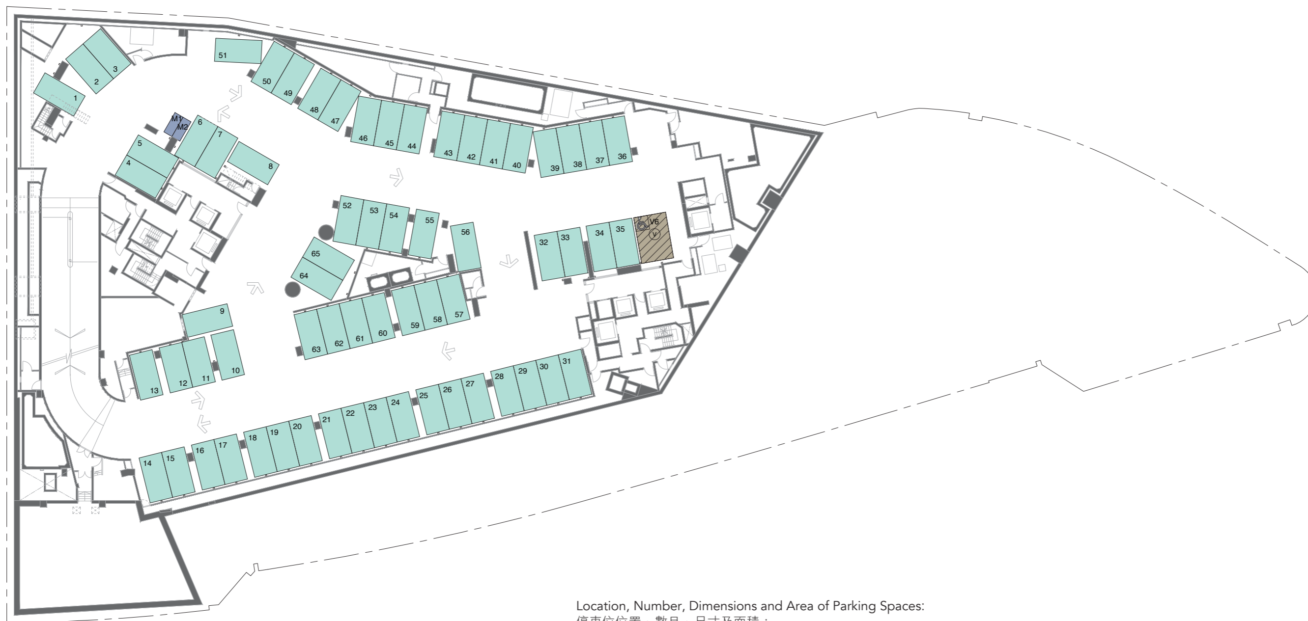
Location, Number, Dimensions and Area of Parking Spaces: 停車位位置、數目、尺寸及面積：