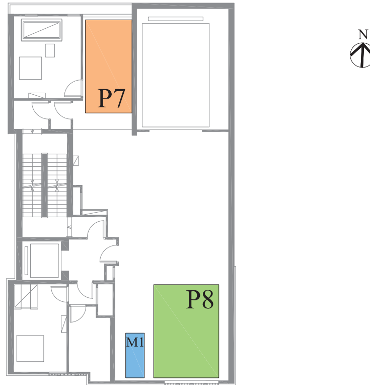
3/F CAR PARK PLAN 3樓停車場平面圖