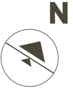
Tower 3 3/F and 5/F Floor Plan 第3座3樓及5樓樓面平面圖